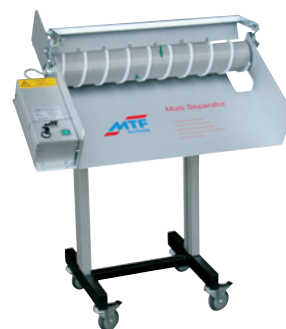
MTF Multi-Separator MS-600